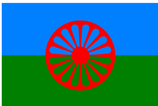
Fig.1. Bandera del pueblo gitano.

Se estima que la población gitana está representada por 10 millones de personas en la Unión Europea y unas 12 millones de personas en todo el mundo ( www.gitanos.org ). En Europa, el mayor porcentaje del pueblo gitano vive en Rumanía (en torno a 4 millones de habitantes), en España, Hungría y Bulgaria (de 500.000 a 600.000 habitantes por cada país) ( www.unionromani.org ) (Fig. 2). Estas cifras no son del todo claras, puesto que el pueblo gitano al ser un pueblo nómada, resulta complicado saber el número exacto de habitantes de cada país. Otro problema es la falta de registro de los niños al nacer, algunas familias gitanas no registran a sus hijos al nacer, lo que hace complicado también su estudio demográfico, proporcionándoles también problemas legales en los países de residencia.